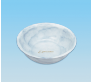
湯桶 / E X ●価格:2,500円 ●サイズ:275φ×97 ●入数:30 ●材質:ポリプロピレン POS/ [W] 563487