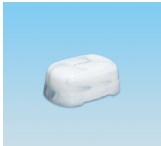
セッケンケース / E X ●価格:800円 ●サイズ:120×83×38 ●入数:90 ●材質:ポリプロピレン POS/ [W] 575480