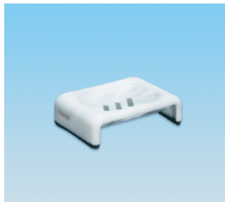
セッケンホルダー / E X ●価格:1,800円 ●サイズ:150×103×39 ●入数:40 ●材質:ポリプロピレン POS/ [W] 566488