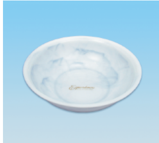
洗面器 / E X ●価格:3,200円 ●サイズ:327φ×97 ●入数:30 ●材質:ポリプロピレン POS/ [W] 564484