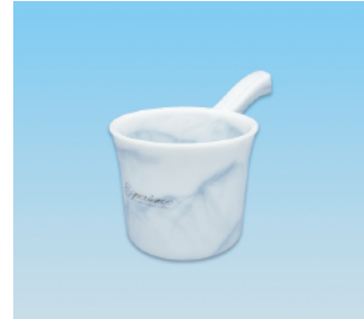
手桶 / E X ●価格:2,300円 ●サイズ:145φ×270×148 ●入数:60 ●材質:ポリプロピレン POS/ [W] 576487