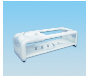
シャンプーデッキ / E X ●価格:3,500円 ●サイズ:366×140×110 ●入数:20 ●材質:ポリプロピレン POS/ [W] 565481