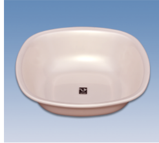
洗面器/角 ●価格:650円 ●サイズ:306×306×86 ●入数:60 ●材質:ポリプロピレン POS/ ㊟417926 ㊟417933