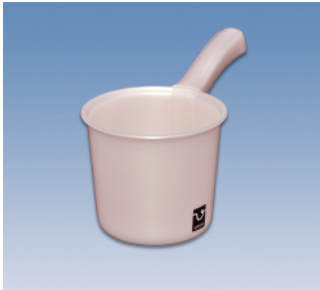
手桶/S ●価格:500円 ●サイズ:139φ×262×154 ●入数:60 ●材質:ポリプロピレン POS/ ㊟417889 ㊟417896