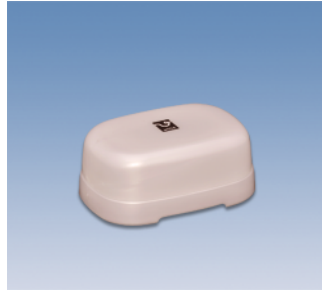
石鹸箱/E ●価格:280円 ●サイズ:106×79×46 ●入数:120 ●材質:ポリプロピレン POS/ ㊟417964 ㊟417971