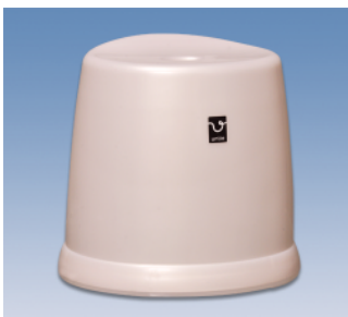
風呂椅子/HL ●価格:2,400円 ●サイズ:353×303×335 ●入数:16 ●材質:ポリプロピレン POS/ ㊟419463 ㊟419470

●価格はすべて税抜き価格です ●共通/バーコード番号 (4973473) ●サイズ表示 横×縦×高 (mm) ●ポンプフンブッシュで約2mlが噴出されます