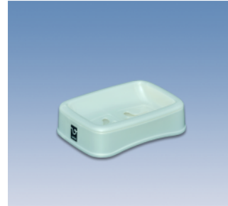
石鹸台/S ●価格:420円 ●サイズ:135×100×36 ●入数:100 ●材質:ポリプロピレン POS/ ㊟419265 ㊟419272