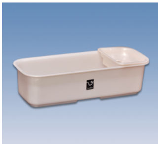
シャンプー台/C ●価格:750円 ●サイズ:320×125×83 ●入数:40 ●材質:ポリプロピレン POS/ ㊟419302 ㊟419319