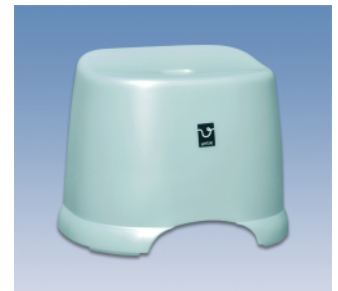
風呂椅子角/HK ●価格:1,850円 ●サイズ:366×280×288 ●入数:24 ●材質:ポリプロピレン POS/ ㊟419425 ㊟419432