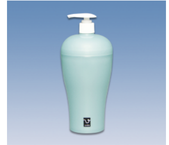
ディスペンサー R ●価格:900円 ●サイズ:97φ×215 ●容量:600ml ●入数:30 ●材質:本体・フタ/ポリプロピレン POS/ ㊟422562 ㊟422579