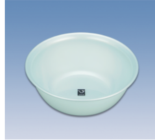
湯桶/S X ●価格:500円 ●サイズ:269φ×100 ●入数:60 ●材質:ポリプロピレン POS/ ㊟421473 ㊟421480