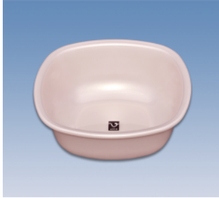
湯桶/角 ●価格:500円 ●サイズ:260×260×97 ●入数:60 ●材質:ポリプロピレン POS/ ㊟417841 ㊟417858