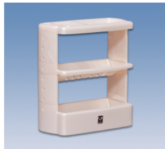
ボトルラック組立式 ●価格:1,850円 ●サイズ:318×148×340 ●入数:20 ●材質:ポリプロピレン POS/ ㊟419340 ㊟419357