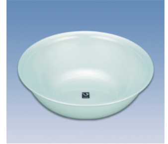
洗面器/S X ●価格:650円 ●サイズ:318φ×101 ●入数:60 ●材質:ポリプロピレン POS/ ㊟421541 ㊟421558