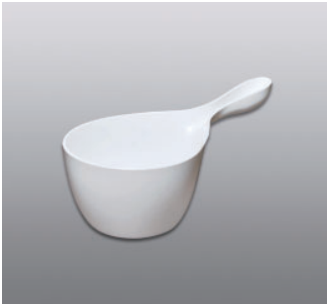
ハンディボール N ●価格：1,000円 ●入数：30 ●サイズ：155×290×126 ●材質：ポリプロピレン ●POS：[Dr-W] 422968