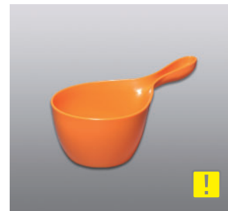
ハンディボール N ●価格：1,000円