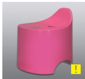
バスツール N ●価格：5,500円