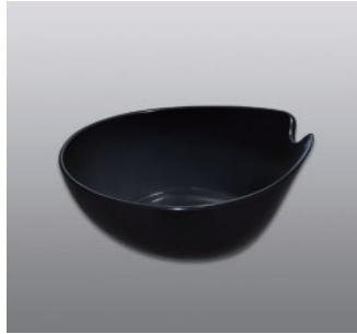
ウォッシュボール N ●価格：1,200円 ●入数：30 ●サイズ：240×265×103 ●材質：ポリプロピレン ●POS：[Dr-Bk] 422920