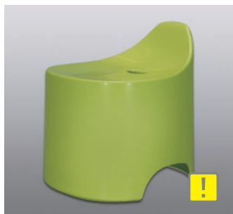
バスツール N ●価格：5,500円