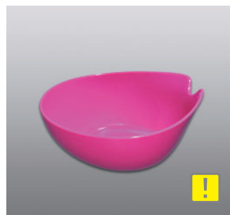
ウォッシュボール N ●価格：1,200円