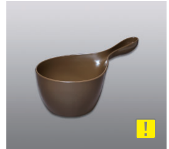
ハンディボール N ●価格：1,000円 ●入数：30 ●サイズ：155×290×126 ●材質：ポリプロピレン ●POS：[Dr-Br] 423026