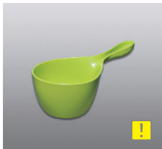
ハンディボール N ●価格：1,000円