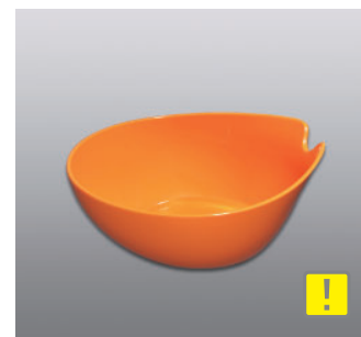
ウォッシュボール N ●価格：1,200円