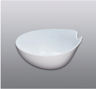
ウォッシュボール N ●価格：1,200円 ●入数：30 ●サイズ：240×265×103 ●材質：ポリプロピレン ●POS：[Dr-W] 422876