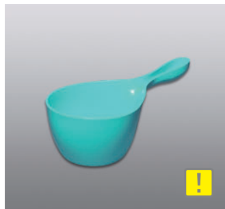
ハンディボール N ●価格：1,000円