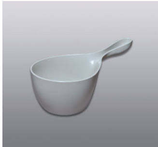
ハンディボール N ●価格：1,000円 ●入数：30 ●サイズ：155×290×126 ●材質：ポリプロピレン ●POS：[Dr-Gy] 423033