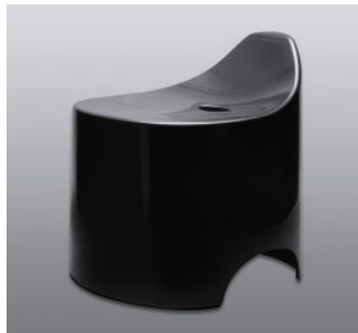
バスツール N ●価格：5,500円 ●入数：4 ●サイズ：330×345×360 ●材質：本体/ポリプロピレン 脚/EVA樹脂 ●POS：[Drp-Bk] 426461