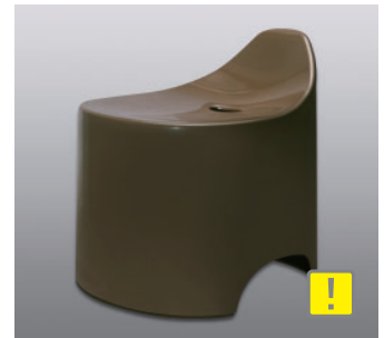
バスツール N ●価格：5,500円 ●入数：4 ●サイズ：330×345×360 ●材質：本体/ポリプロピレン 脚/EVA樹脂 ●POS：[Drp-Br] 426478