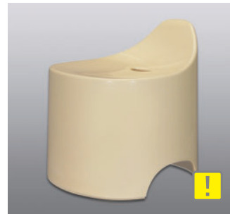
バスツール N ●価格：5,500円 ●入数：4 ●サイズ：330×345×360 ●材質：本体/ポリプロピレン 脚/EVA樹脂 ●POS：[Drp-Y] 426492