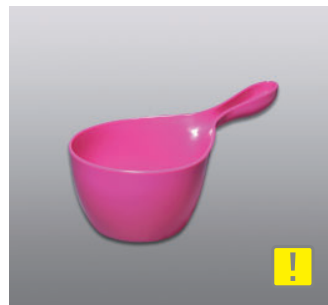
ハンディボール N ●価格：1,000円