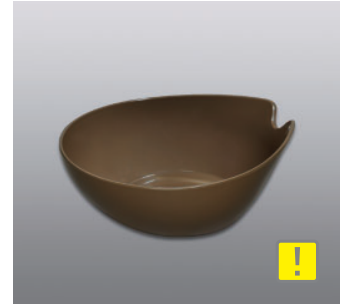
ウォッシュボール N ●価格：1,200円 ●入数：30 ●サイズ：240×265×103 ●材質：ポリプロピレン ●POS：[Dr-Br] 422937