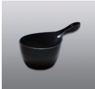
ハンディボール N ●価格：1,000円 ●入数：30 ●サイズ：155×290×126 ●材質：ポリプロピレン ●POS：[Dr-Bk] 423019