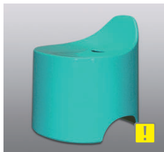
バスツール N ●価格：5,500円