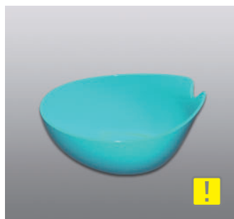
ウォッシュボール N ●価格：1,200円