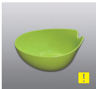
ウォッシュボール N ●価格：1,200円