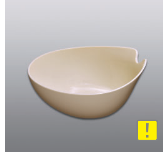
ウォッシュボール N ●価格：1,200円 ●入数：30 ●サイズ：240×265×103 ●材質：ポリプロピレン ●POS：[Dr-Y] 422951