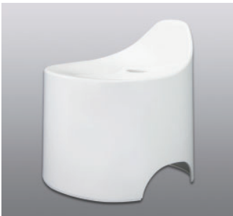
バスツール N ●価格：5,500円 ●入数：4 ●サイズ：330×345×360 ●材質：本体/ポリプロピレン 脚/EVA樹脂 ●POS：[Drp-W] 426416