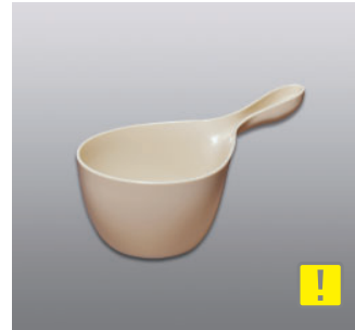
ハンディボール N ●価格：1,000円 ●入数：30 ●サイズ：155×290×126 ●材質：ポリプロピレン ●POS：[Dr-Y] 423040