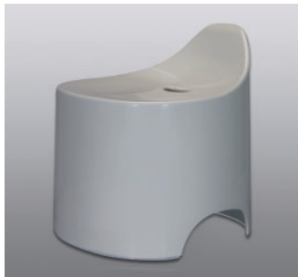
バスツール N ●価格：5,500円 ●入数：4 ●サイズ：330×345×360 ●材質：本体/ポリプロピレン 脚/EVA樹脂 ●POS：[Drp-Gy] 426485