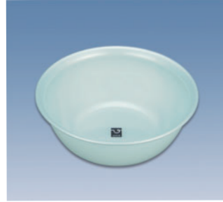
N. 湯桶/SX ●価格:650円 ●サイズ:269φ×100 ●入数:60 ●材質:ポリプロピレン POS/ 430482 430499