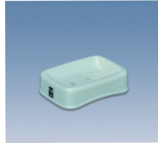
石鹸台/S ●価格:420円 ●サイズ:135×100×36 ●入数:100 ●材質:ポリプロピレン POS/ 419265 419272