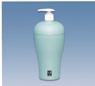
ディスペンサー R ●価格:900円 ●サイズ:97φ×215 ●容量:600ml ●入数:30 ●材質:本体・フタ/ポリプロピレン POS/ 422562 422579