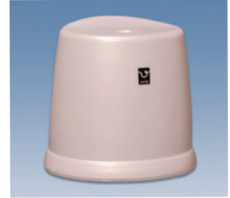
N. 風呂椅子/HL ●価格:3,600円 ●サイズ:353×303×335 ●入数:8 ●材質:ポリプロピレン POS/ 430307 430314

●価格はすべて希望小売価格(税抜き)です ●共通バーコード番号(4973473) ●サイズ表示 横×縦×高(mm) ●ポンプフッシュで約2mlが噴出されます