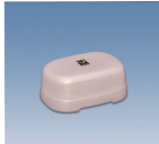
石鹸箱/E ●価格:280円 ●サイズ:106×79×46 ●入数:120 ●材質:ポリプロピレン POS/ 417964 417971