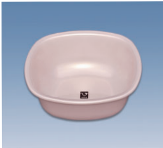
N. 湯桶/角 ●価格:650円 ●サイズ:260×260×97 ●入数:60 ●材質:ポリプロピレン POS/ 430420 430437