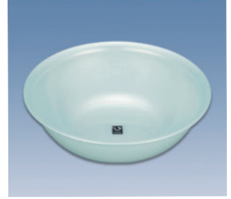
N. 洗面器/SX ●価格:850円 ●サイズ:318φ×101 ●入数:60 ●材質:ポリプロピレン POS/ 430604 430611