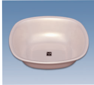
N. 洗面器/角 ●価格:850円 ●サイズ:306×306×86 ●入数:60 ●材質:ポリプロピレン POS/ 430543 430550