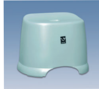
N. 風呂椅子角/HK ●価格:2,800円 ●サイズ:366×280×288 ●入数:12 ●材質:ポリプロピレン POS/ 430246 430253