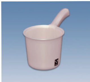
N. 手桶/S ●価格:650円 ●サイズ:139φ×262×154 ●入数:60 ●材質:ポリプロピレン POS/ 430369 430376