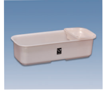
シャンプー台/C ●価格:750円 ●サイズ:320×125×83 ●入数:40 ●材質:ポリプロピレン POS/ 419302 419319